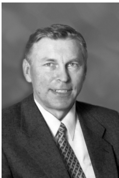
Помощник Председателя Правительства РФ, Министр образования РФ (1998-2004 гг.) д.физ.-мат.н. Владимир Михайлович Филиппов

Появление более двухсот лет назад первого толкового словаря русского языка, коим явился изданный трудами Е.Р.Дашковой и ее соратников по Академии шеститомный Словарь Академии Российской, стало выдающимся событием в истории страны. Оно дало ощутимый толчок развитию русского языка и литературы, образования и культуры в России. Нынешнее переиздание этого уникального памятника отечественной лексикографии, осуществляемое Московским гуманитарным институтом имени Е.Р.Дашковой, несомненно будет способствовать приобщению миллионов россиян к истории российской словесности, богатству русского языка. Словарь Академии Российской, переживающий второе рождение, безусловно найдет своего читателя не только среди ученых, специалистов по филологии и лингвистике, но и среди всех любителей и почитателей русского слова.