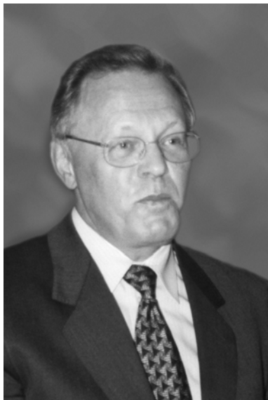
Президент Российской академии наук, академик, д.физ.-мат.н. Юрий Сергеевич Осипов

Создание Словаря Академии Российской было первым испытанием для молодой российской науки, которое она с честью выдержала. Издание гнездового (1789–1794), а затем и алфавитного (1804–1822) словарей объединило лучшие естественно-научные и гуманитарные силы русского общества. Консолидирующая роль словарей, забота о языке и его нормах стали настолько ясными, что при объединении с Санкт-Петербургской Академией наук в 1841 г. именно это название — Российская Академия наук — закрепилось за всей Академией. И поныне языковые проблемы, словарные работы относятся к числу приоритетов науки и государства.